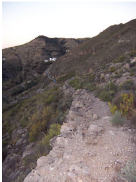
Vista del caminillo viejo

Tras su rehabilitación se incorporaría a la futura red de caminos tradicionales del municipio, siendo un elemento de valor para el desarrollo del turismo cultural y medioambiental de la zona.