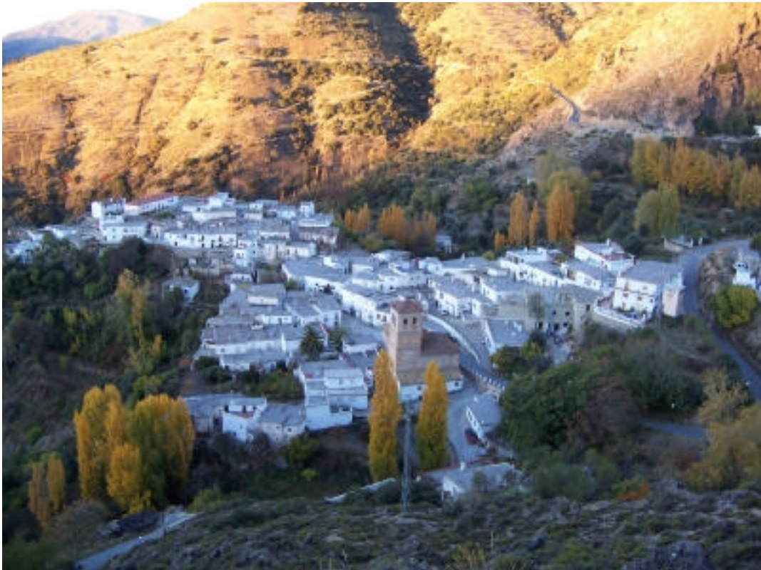
Vista del Barrio Bajo de Cástaras desde el Caminillo Viejo