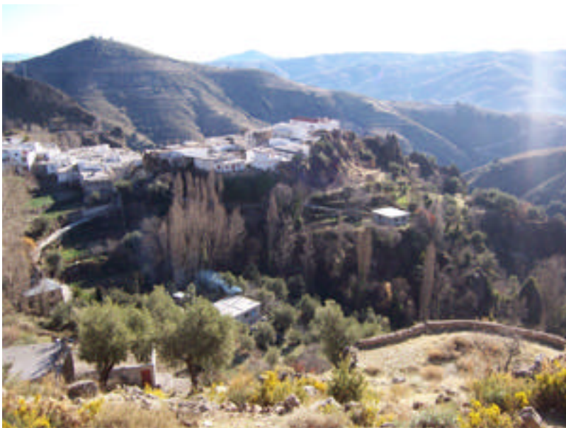
Vista de la era y Barrio Bajo de Cástaras

Acondicionamiento del camino de acceso a la era. Limpieza de vegetación baja y restauración del empedrado. Restauración de parte del pretil y señalización del camino y de la era.