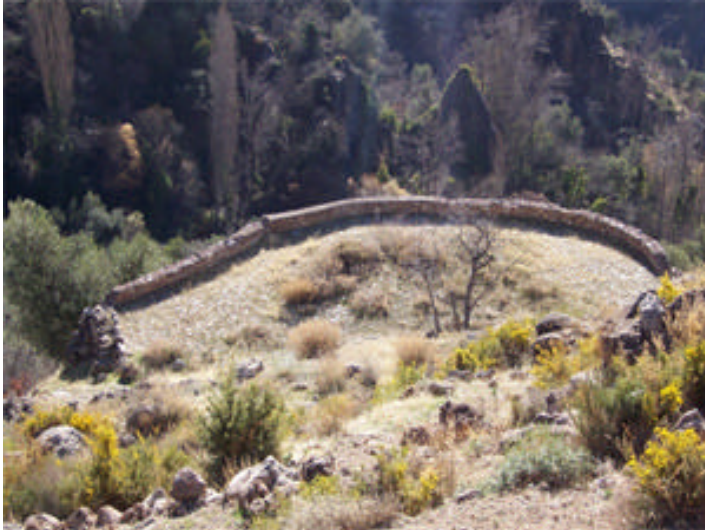
Vista de la era